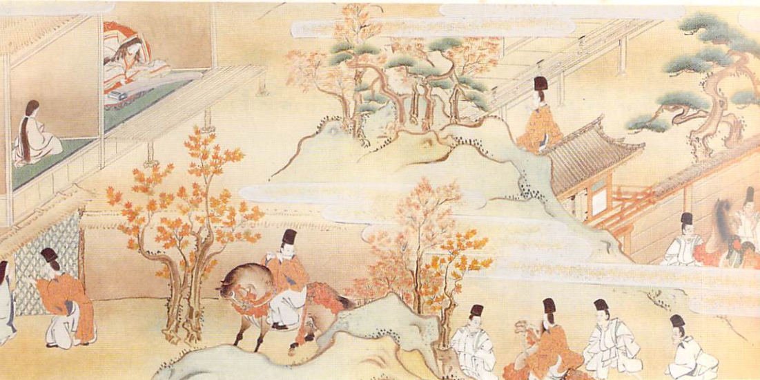
「平家物語絵巻」の小督