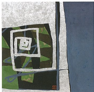
「COLLIDING」コン キム ホア(ベトナム) 2011年制作／漆、木／H550×W550×D30mm