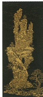
「The Mountain of the Universe」チャンタナ チャンティム(タイ) 2005年制作／漆、木、金箔 H850×W380×D60mm