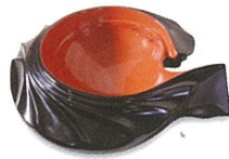
「帰山」俞峰(中国)／2012年制作 木、漆／H430×W460×D110mm