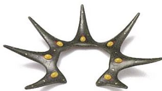
「Blooming green thorn」 ユン サンヒ(韓国) 2007年制作／漆、麻布、銀、真鍮、琥珀 H390×W300×D70mm