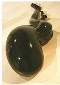
「BODY10-1」青木 千絵(日本) 2010年制作 漆、麻布、スタイロフォーム H500×W1700×D900mm