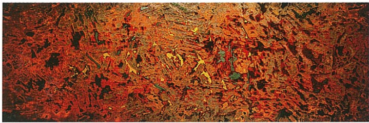
「A-Puzzling-Statement」 ニヤットラン(アメリカ)／2010年制作／漆、木板／H368×W978×D51mm