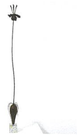
「libido」吾子 可苗(日本)／2012年制作 漆、和紙、木、金粉、銀粉、白蝶貝、金属 H850×W120×D90mm