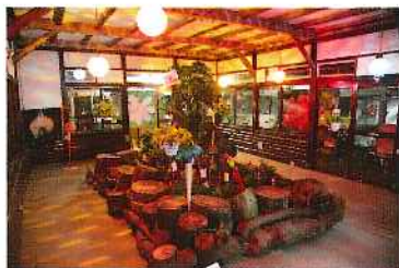
「大甲ミーツ・アート芸術祭2011」大甲山カンツリーハウス/2011