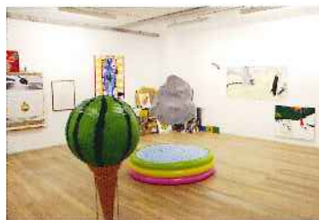
「ハジメテンの真夏の教室」CAPSULE/2012