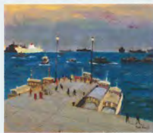
小出卓二「神戸メリケン波止場」 1972年頃 油彩・キャンバス