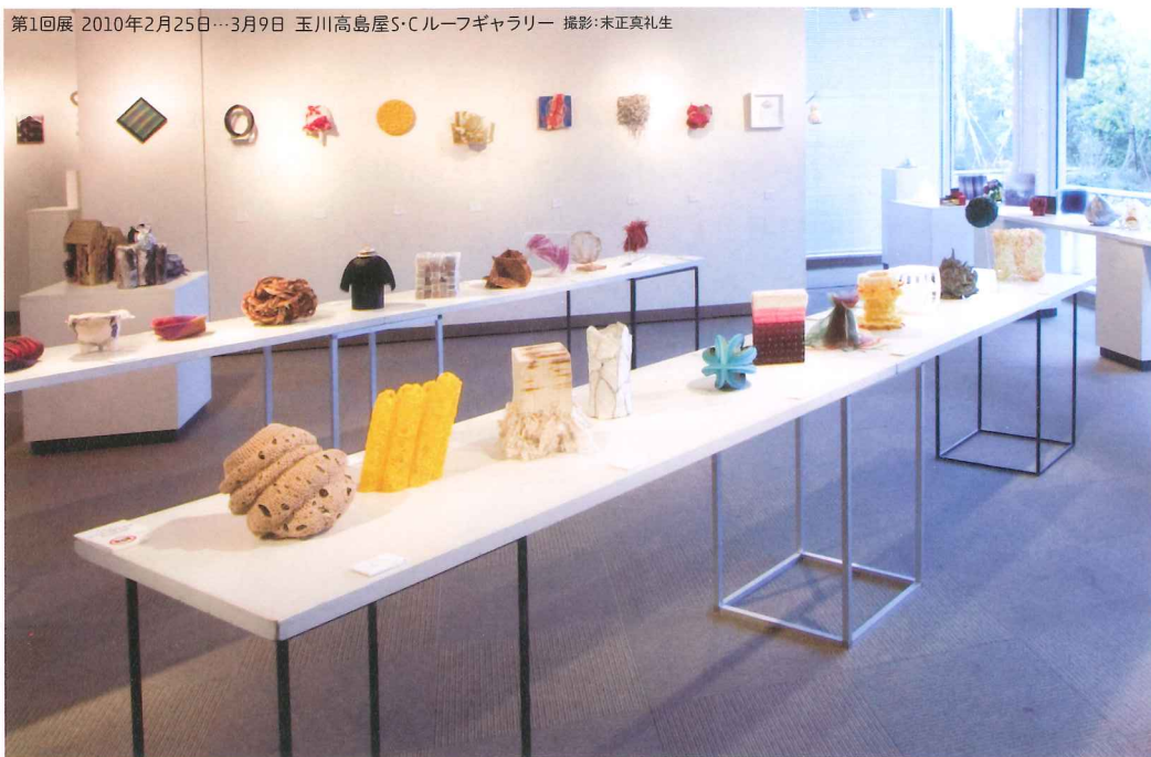
第1回展 2010年2月25日…3月9日 玉川高島屋S・Cルーフギャラリー