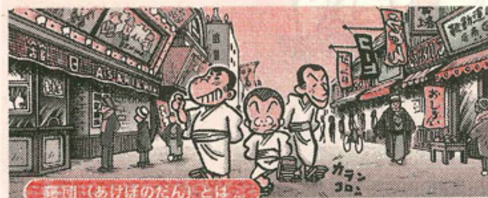
曙団(あけぼのたん)とは

盛り場として繁栄していた大正時代の新開地を、わがもの顔でのし歩く曙団(あけぼのたん)という奇妙なチンピラグループがいました。2003年、アートブックを作るべく、現代の新開地をフィールドワークするために結成されたプロジェクトチームを「曙団」と称することにしました。