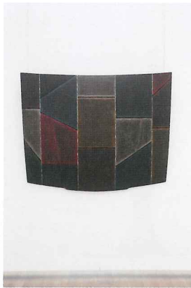
上衫の胸服Ⅱ | h1200×w1500mm 2006

本展では、樹皮を使った新しい壁面作品シリーズをはじめとする、漆造形作品約50点と漆器作品約100点を紹介いたします。漆の持つ特性と概念を深めることによって、常に新しい漆の世界を切り開く栗本夏樹の漆造形の世界をお楽しみください。