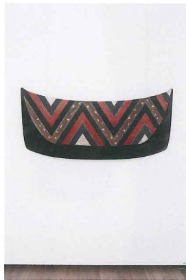
荘厳Ⅱ | h720×w1460mm 2007