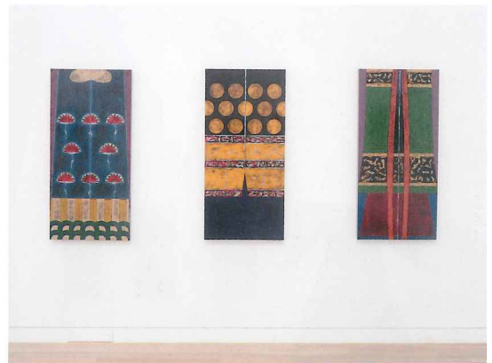
華の衣・月の衣・草の衣 | 各h1160×w545mm 1997