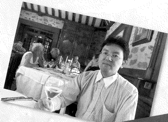
ノアン (サンドの館) にてショパンコースを食す