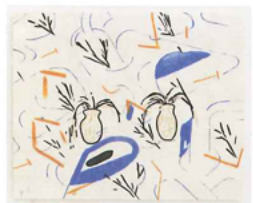
two vases #1 2015