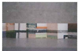
black line 2015