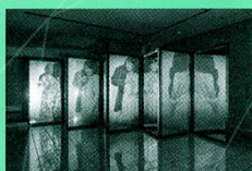
Ghost | 2015

おもな展覧会は『こもれび(水戸芸術館/2003)』『夏の蟹気楼展(群馬県立館林美術館/2005)』『トランスメディアール2010(The House of World Cultures/ベルリン)』、個展に『Dune/Trip(PH Gallery/NY/2005)』『嘔吐(大阪府立現代美術センター/2007)』『Pearls(The Third Gallery Aya/大阪/2010)』『TEGAMI -日本人アーティストの視点-稲垣智子(フリーゼーアーティストハウス/ハンブルグ/2016)』などがある。