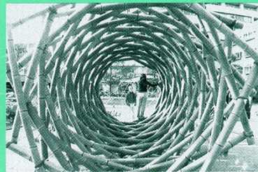
フィボナッチトンネル | 2008

築』(1990)、『音楽の建築』(2006)がある。現在、静岡県榛原郡川根本町にて幾何学的農園の建設と幾何学的民族音楽の育成に着手している。