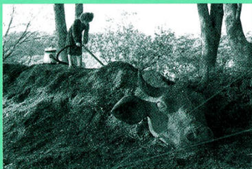
One Day I meet... | 2007

「One Day I meet... vol.2」(NADiff a/p/a/r/t 東京)、グループ展に2008年「Bains Numeriques #3」(Centre des Arts Enghien les Bains フランス)、2009年「Spooky Action at a Distance」(Black and Blue Gallery シドニー)、2010年「The God of The Small Things」(Casa Masaccio Centro Per L'Art Contemporanea イタリア)他。