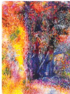
VOCA奨励賞 武居功一郎 《untitled (adaptation)》