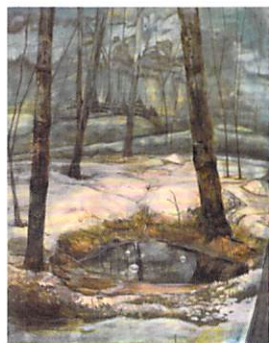
佳作賞・大原美術館賞 柏原由佳 《21'19》《クルイスク》