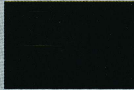
4. 《Latent Image》2011