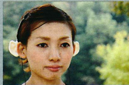
12. 《電気耳 The enhanced ears ～共感の設計ワークショップシリーズ～》2011