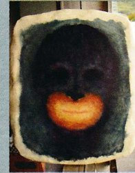
5. 《quiet(early night)》2011