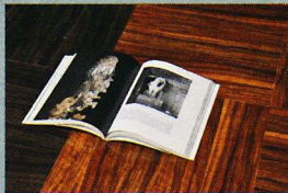
11. 《Dancing in a cloud》2011