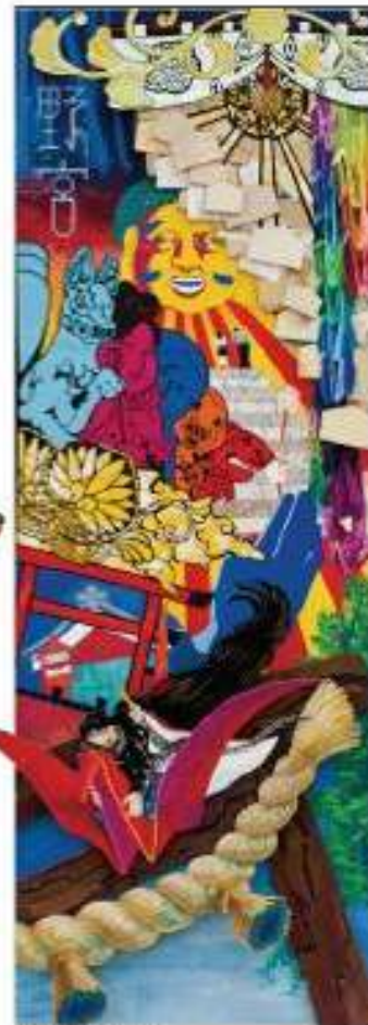
野宮神社 | 藤原 夏貴