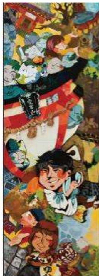
愛宕神社と保町並み | 泉田 真子