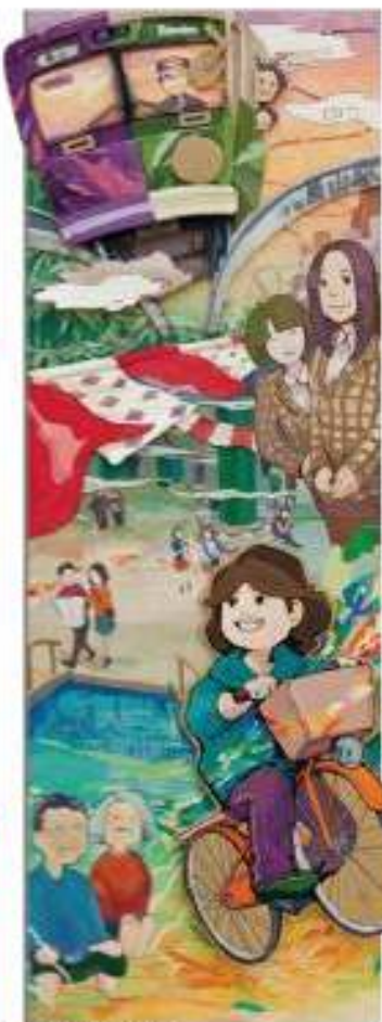
嵯峨嵐山駅 | 尾立 賢