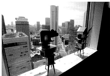
salon cojica, 2013