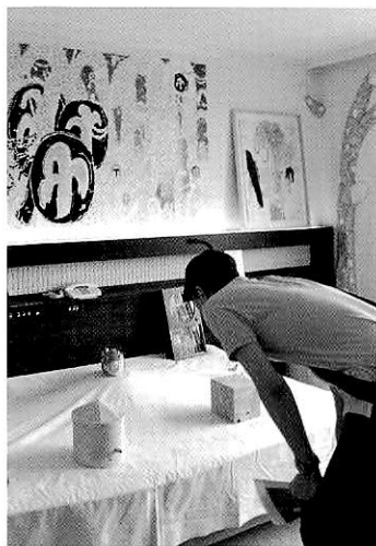
Gallery Artzone-Kaguraoka, 2013