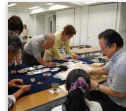
前回実施の様子(2012年)