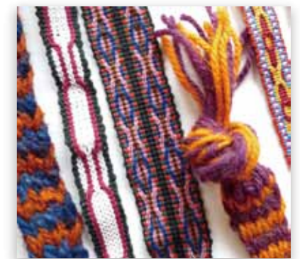
ウズベキスタンの紐いろいろ (イメージ)