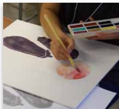
前回実施の様子(2012年)

希望者への画材の販売も予定しています。(要事前予約/申込者には別途ご案内いたします)