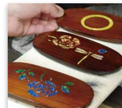
前回実施の様子(2011年)