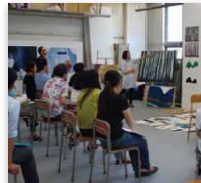
前回実施の様子(2011年)