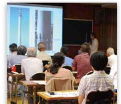
前回実施の様子(2012年)