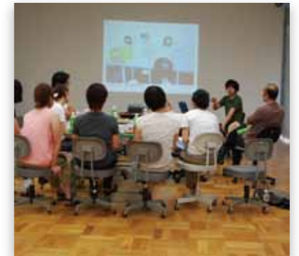
前回実施の様子(2011年)