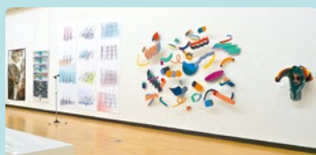
2017年 東京藝術大学での展覧会の様子

東京藝術大学、金沢美術工芸大学、京都市立芸術大学の3大学染織専攻から選抜された大学院生の展覧会。