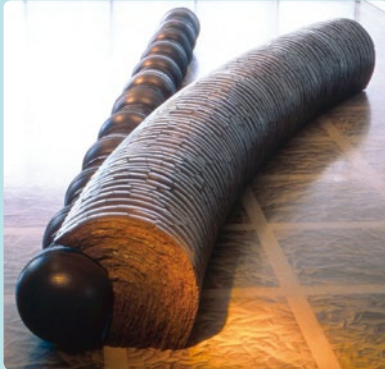
秋山陽《Oscillation II》 51cm × 600cm × 167cm 1989年