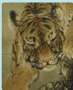
西山翠峰「虎」(模写・部分)

本展は平成 30 年が明治改元から満 150 年の節目の年に当たることを記念した「明治 150 年・京都のキセキ・プロジェクト」の一環として開催します。美術家の田村友一郎監修のもと、本学の前身・京都府画学校の創立者の一人であり、煎茶道の発展に寄与したことで知られる日本画家の田能村直入の足跡を辿りながら、新たな物語を紡ぎ出すことにより収蔵品の「演出」を試みます。