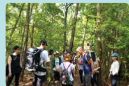
2018年6月のレクチャーパフォーマンスの様子

さまざまな業種の人々との協働作業を通じて、アートの世界とそれとは異なる世界とを接続し、その関係性やそれぞれのあり方を問いかける活動を行うベルリン在住の作家、クリスチャン・ヤンコフスキー氏を招聘し、日本初の個展を開催します。2018年6月の京都でのリサーチや、本学出身の若手作家や学生などを変えたレクチャーパフォーマンスを経て制作された作品を発表します。