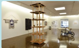
昨年度の様子

世界各国からの本学留学生による展覧会。本学で学び、独自の作風を切り開く留学生たちの力作を展示します。