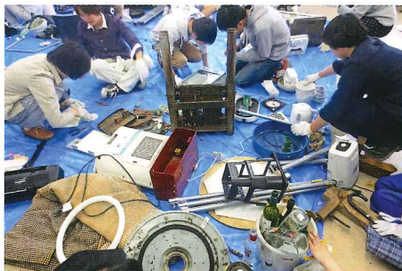
第二課題『モノ語り／もうひとつモノ語り』