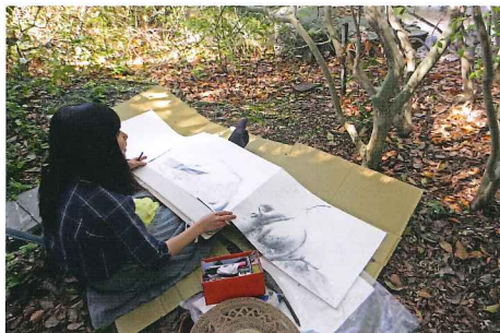
第一課題『校内にて』…詩を紡ぐ…

京都市立芸術大学芸大ギャラリー | 7月18日[土]-8月2日[日] | 9:00-17:00 | 休館日：月曜日（月曜が祝日の場合は、翌日休館） | 観覧料：無料