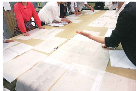
第三課題『街並に貢献する町家をつくる。』