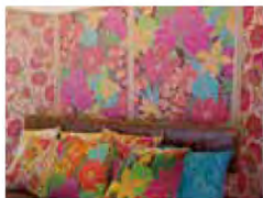
■屏風の世界と空間装飾 (屏風とテキスタイルの展示) 作者：田代 貴子

1960年代後半の京都市内を撮影したもの。 当時の日常の光景を撮影した貴重な写真の中 から厳選した10枚の作品。