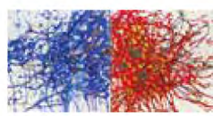
■幻響「DIAMOND SELF」 作者：米田 夏夜

平面紙の屏風と立体に仕上げたクッション(布)との 構成にて極彩色の空間に奥行きを持たせた空間演出。