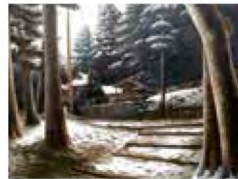
■静原 作者：藤本 崇幸

京都の西陣織の一つ「爪掻き 本綴織 (つめかき ほんつづれおり)」という技法 を使って八寸名古屋帯を制作。