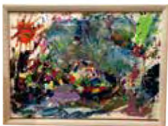
■太陽 作者：土田 尚月

「真我の目覚め」を表現。愛と感謝に満ちた 真我。その目覚めをアクション ペインティングで表現しました。