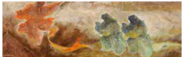
■舞楽図 作者：中村 七海

歌舞伎文字(勘亭流)は江戸時代から240年 もの間「手書き」によって受け継がれてきた 伝統技術。