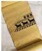
■ギリシャ黒絵式アンフォラより 「ブラックパンサー」 作者：菊池 杏子

五山の送り火 松ヶ崎の「妙法」に代々火をつける 家に生まれた作者ならではの想いを込めた作品。