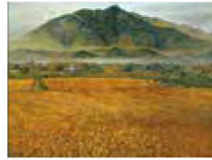
■愛宕山～千代の古道～ 作者：戸倉 英雄

早朝の愛宕山を仰ぎながら稲刈をする 人々を描く。永久の五穀豊穡を願った ノスタルジックな作品。