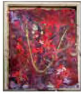
■熱唱の紅葉 作者：金谷 由美

場所：ロビー (1F) 最終日のみ 17:00 まで 京都にゆかりのある方々の作品を展示いたします。