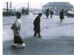
■写真集「京都」 作者：森 裕貴

壁から咲き誇る、たくさんのカラフルな花々を 描きます。京都のイメージを覆すような派手で カラフルなパワーを表現。