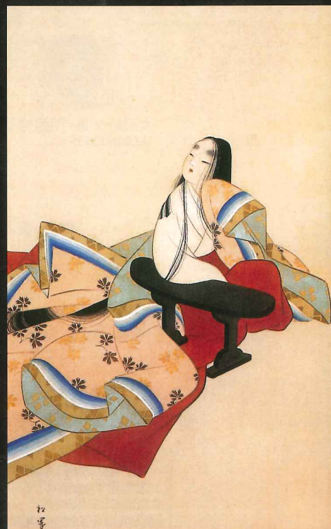
上村松園筆「紫式部図」(石山寺蔵)

後援:滋賀県・滋賀県教育委員会・大津市・大津市教育委員会・KBS京都・BBCびわ湖放送 エフエム滋賀・朝日新聞大津総局・読売新聞大津支局・毎日新聞大津支局・京都新聞滋賀本社