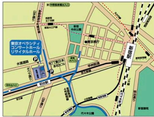
京王新線「初台駅」東口 徒歩1分 (京王線相互乗り入れ都営新線にて新宿から2分) リサイタルホールは、東京オペラシティビル地下1階にございます。

【チケット料金】 3,000円 (全席自由) 未就学児の入場はご遠慮ください。 【チケット取扱】 東京オペラシティチケットセンター Tel: 03-5353-9999 (電話受付時間: 10:00 - 18:00) チケットぴあ Tel: 0570-02-9999 (音声自動応答・Pコード: 118-093) http://t.pia.jp (PC & 携帯) 【お問い合わせ】 株式会社AMATI Tel: 03-3560-3007 (平日お問い合わせのみ) 主催: K's Blue Production 協力: 株式会社AMATI、ナヤ・コレクティブ 助成: 芸術文化振興基金助成事業 sacem SPEDIDAM Grand Est