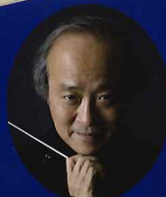
尾高忠明