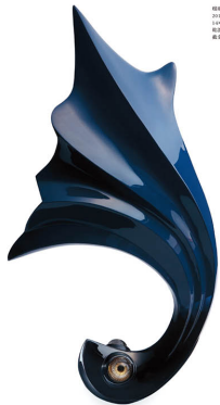
龍巻のさかな 2019 1.8×18×15cm 樹脂、金魚すくい 義孝すくい山手島