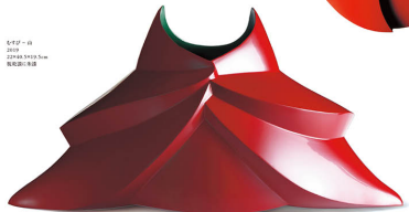
お月様 - 魚 2019 22×18.5×13.5cm 樹脂に彫造