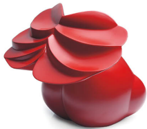
金魚 - 44号 2019 20.5×21×18cm 樹脂に彫造