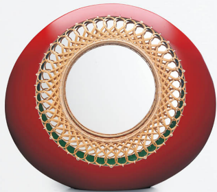
空のさかな 2019 12×55.1×45.5cm 紙張り・漆 平岡代太郎制作