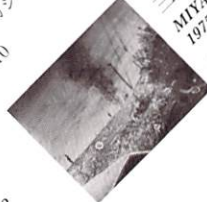
三宅紗織 MIYAKE Saori 1975- 《monogatari》 ゼラチン シルバークラフト 2011