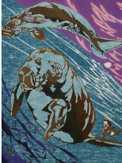
日下部雅生 「ジュゴンと少年」 (型絵染)