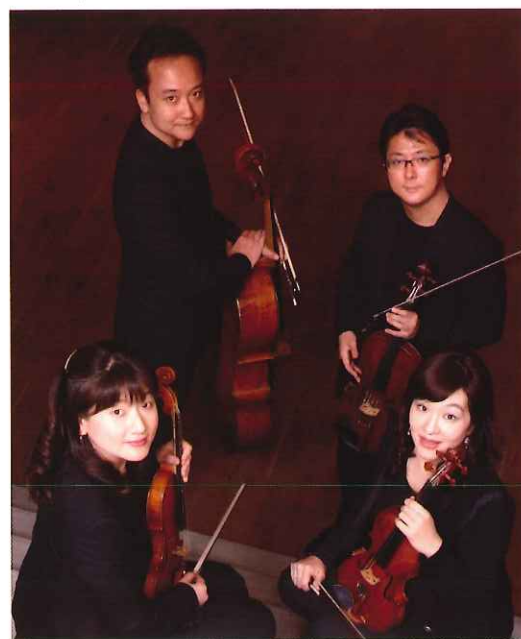
関西弦楽四重奏団