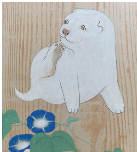
▲ 円山応挙「仔犬図」(部分)

※ 作業着(エプロンなど)をご持参いただくか、汚れてもよい服装でお越しください。