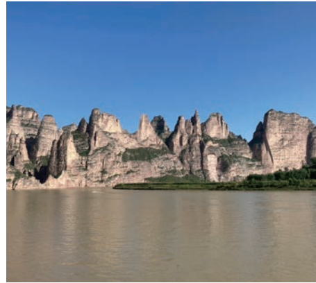
▲ 炳靈寺石窟付近の風景 (甘肅省、2025年)

中国絵画は三千年を超える歴史があり、日本絵画にも大きな影響を与えてきました。長大な時空の中で生まれ伝えられてきた中国絵画の展開をたどり、山水画、人物画、花鳥画などの鑑賞ポイントをご紹介します。本学芸術資料館所蔵の絵画作品や資料も閲覧していただく予定です。