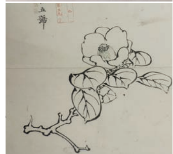
▲ 京都府画学校絵手本より 椿2種 (京都市立芸術大学芸術資料館蔵)