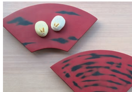
▲ 根来塗風の末広皿(制作例) ※ 制作するお皿はお一人につき1枚です。

今回はあらかじめ講師が黒漆の上に朱漆を塗り重ねた末広皿を、紙やすりを使って下の黒漆まで研ぎ出し、磨いて仕上げさせていただきます。