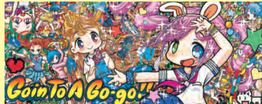
Mr.《Go to A Go-go!!》2014（平成26）年 Courtesy Kaikai Kiki Gallery ©2014 Mr./Kaikai Kiki Co., Ltd. All Rights Reserved.