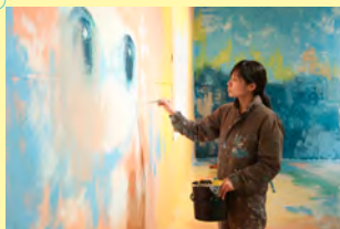
ob「乙女の祈り展」制作風景 2013（平成25）年