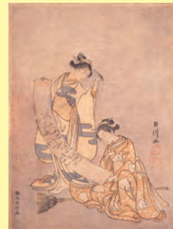
鈴木春信《見立寒山拾得》 ※前期展示 1765（明和2）年 千葉市美術館蔵