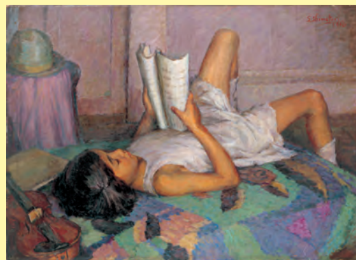
菊島之彦《少女（休憩）》1926（大正15）年 京都市美術館蔵

Tel 017-783-3000 Fax 017-783-5244 www.aomori-museum.jp