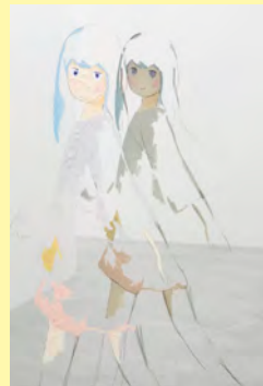
谷口真人《Untitled》（部分） 2014（平成26）年 個人蔵