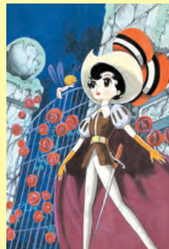
手塚治虫《リボンの騎士》 （『なかよし』1964年6月号ふろく表紙絵） 1964（昭和39）年 ©手塚プロダクション