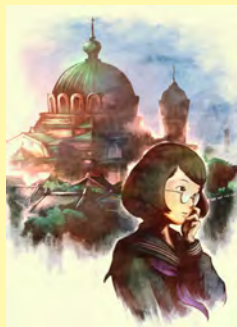
塚原重義 アニメ《女生徒》イメージイラスト © 美少女の美術史展実行委員会