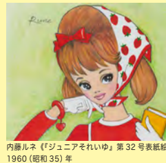
内藤ルネ《『ジュニアそっくり』第32号表紙絵》 1960（昭和35）年 株式会社ルネ蔵 ©R.S.H/RUNE