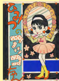
赤塚不二夫《ひみつのアッコちゃん》 （『りぼん』1963年3月号扉画 ※本行本化の際に着色） 1963（昭和38）年 株式会社フジオ・プロダクション蔵 ©フジオプロ