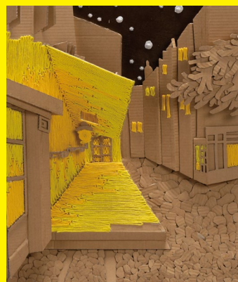
上：フィンセント・ファン・ゴッホ《糸杉のある麦畑》二次創作 / 小野一葉 左：エドヴァルド・ムンク《叫び》二次創作 / 稲岡莉々 右：フィンセント・ファン・ゴッホ《夜のカフェテラス》二次創作 / 小幡咲奈