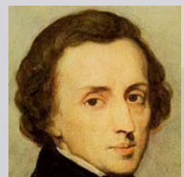
ショパン/F.Chopin バラード4番/Ballade No.4 Op52

ラヴェル/M.Ravel 〈夜のガスパール〉より/Gaspard de la nuit 1.オンディーヌ/1.Ondine 2.絞首台/2.Le Gibet 3.スカルボ/3.Scarbo