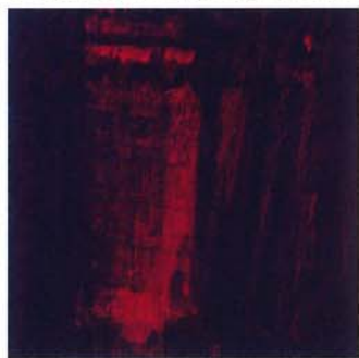
「折りの空間」1990年制作 128x128cm 木製パネル、漆など