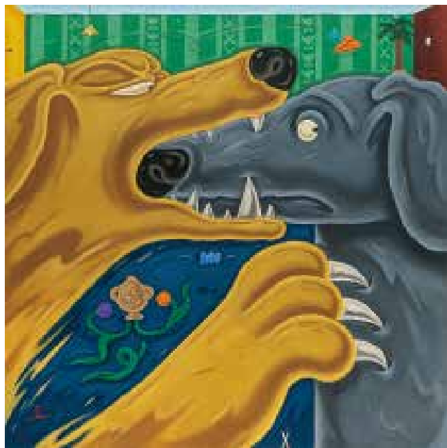
高瀬菜菜《噛み犬噛まれ犬(どうしてなん)》2024年