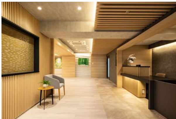
チャームプレミア 浜田山 (第19回)