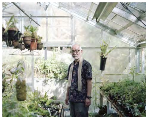
自宅兼アトリエの温室にて