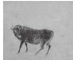
入江波光「駿牛図」(1933年)(第2期)